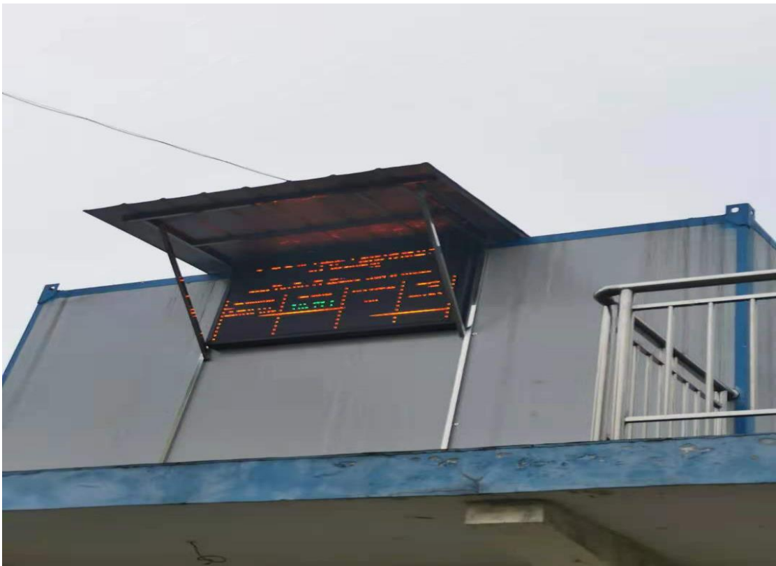
废气（非甲烷总烃）在线监测